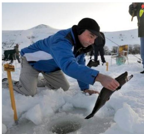
Pêche à partir d'un trou dans la glace