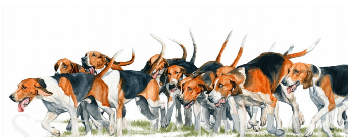
Une meute de chien

Oralement, décrivez avec votre enfant les 4 images ci-dessous.