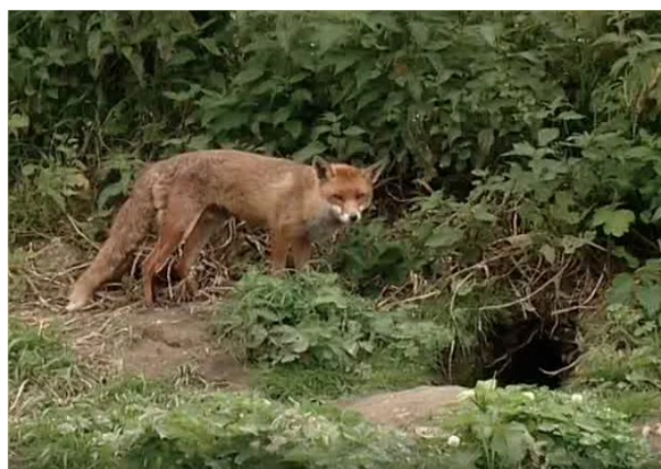
Une tanière de renard