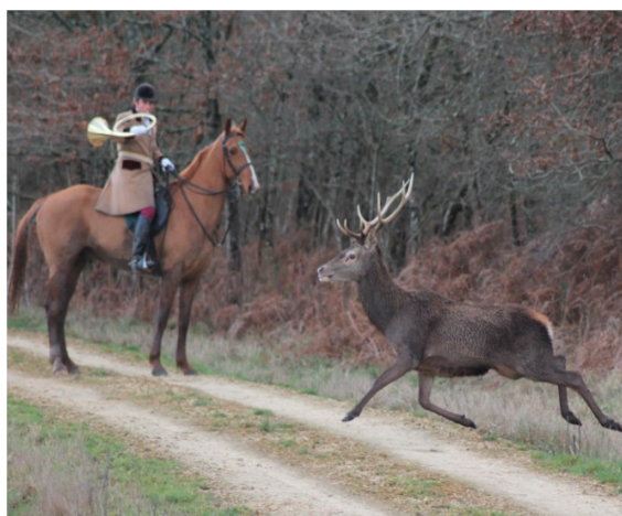
Un veneur joue du cor de chasse