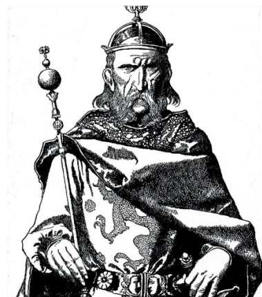
Uther Pendragon, roi de Bretagne, père d'Arthur.