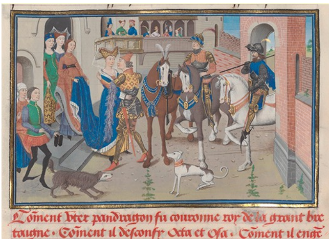
Uther Pendragon tombe amoureux d'Ygerne

Uther hoche la tête très très vite plusieurs fois d'affilée.